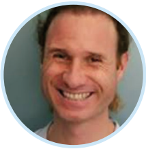
Dr. Alberto Fernández